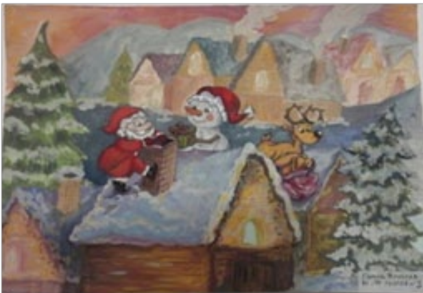
Попов Ярослав, МБДОУ «Детский сад №79»

Под веселую музыку дети покидают зал. Праздник продолжается в группе.