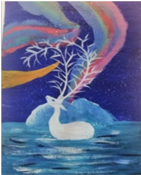
«Северное сияние» (совместная работа)