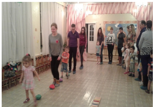
Перепрыгни через препятствие